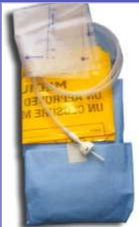
2000ml Drainage- beutel bei Aszites (Bauchwasser)

Für den Patienten ergeben sich durch diese Maßnahme verbesserte Lebensqualität, eine Symptomkontrolle und eine Verringerung der klinischen Aufenthalte.