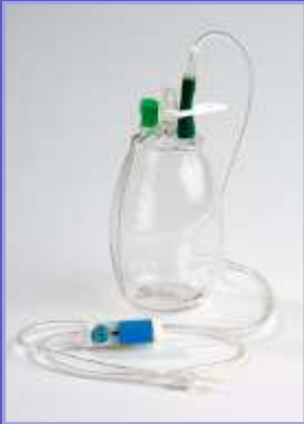
600ml Drainage- flasche bei Pleura- erguss

Für den Patienten ergeben sich durch diese Maßnahme verbesserte Lebensqualität, eine Symptomkontrolle und eine Verringerung der klinischen Aufenthalte.